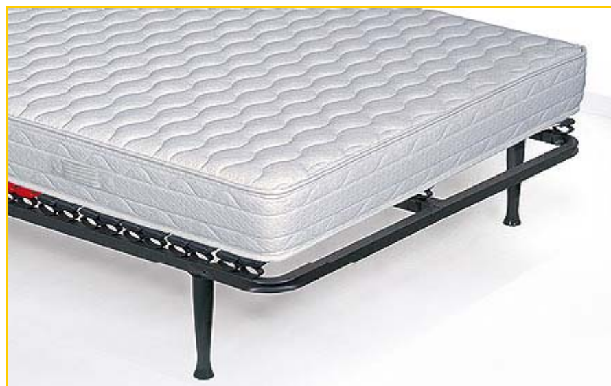
Detalle del Colchón